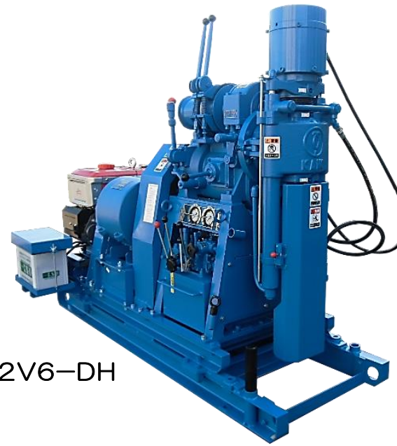
☆KR-100HB-2V6-DH ドラム・V6-D 油圧チャック 油圧式スライドベース