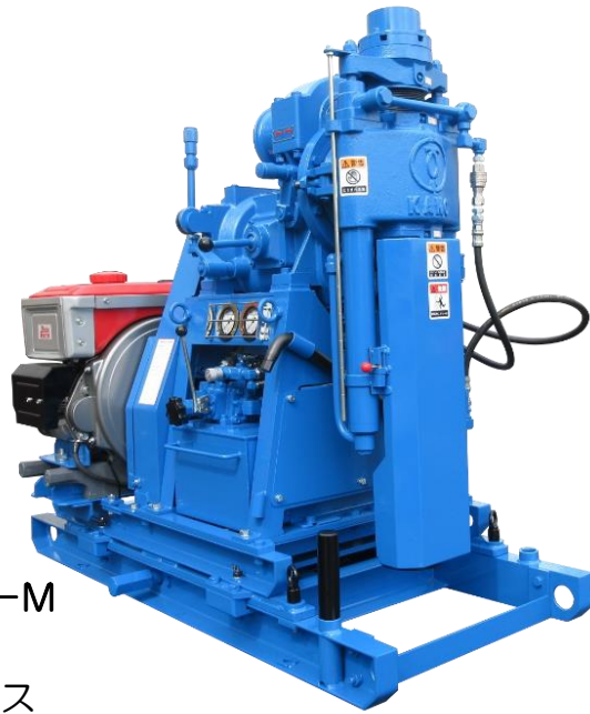
☆KR-100PB-1-M ドラムレス 手動式スライドベース