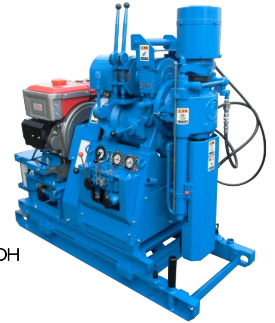
☆KR-100HB-3V5-DH ドラム・V5-P 油圧チャック 油圧式スライドベース 乱巻き防止装置