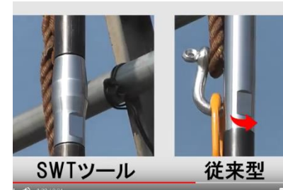
SWTツール 従来型 打撃による緩み発生の比較