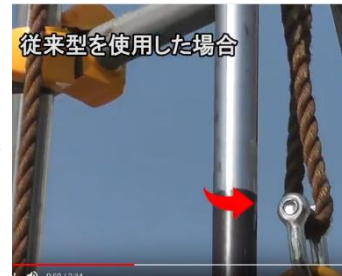
従来型を使用した場合