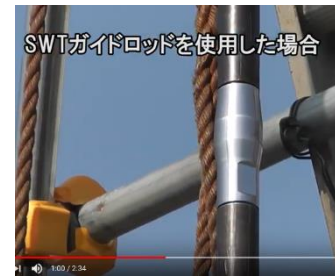
SWTガイドロッドを使用した場合