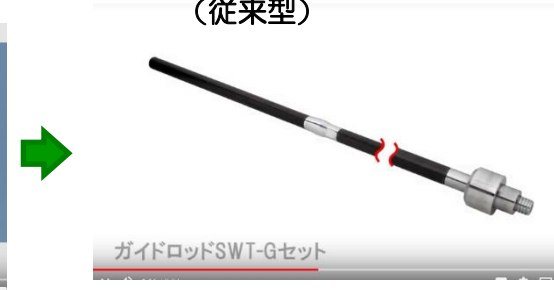
ガイドロッドSWT-Gセット 標準貫入試験用ガイドロッドセット