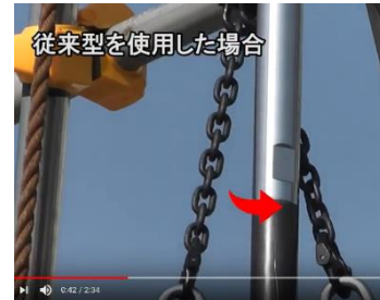
従来型を使用した場合